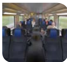
TER @ Siemens