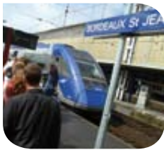
Aquitaine – TER @ Transport Public

www.journeedutransportpublic.fr / espace « presse »