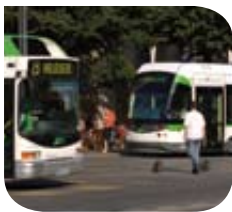
Nantes – Bus et tramway