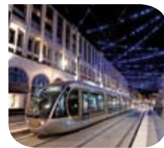
Nice – Tramway @ Éric Boizet Œuvre d'art Yann Kersalé