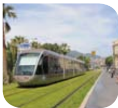
Nice – Tramway @ Ville de Nice