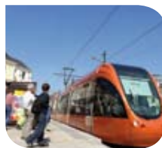
Le Mans – Tramway