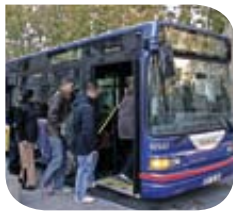
Avignon – Bus @ Transport Public