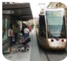
Orléans – Tramway @ Transport Public