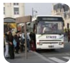
Versailles – Car @ Transport Public