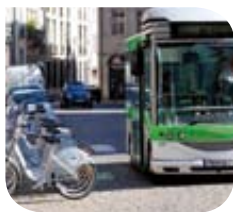
Dijon – Bus et vélos