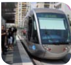
Nice – Tramway