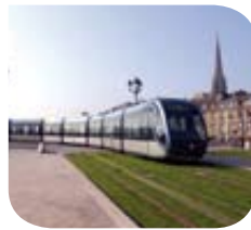
Bordeaux – Tramway @ Transport Public