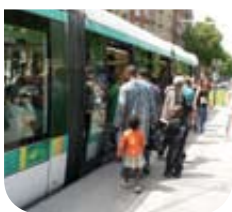
Paris – Tramway @ Objectif transport public