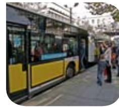
Brest – Bus @ Transport Public