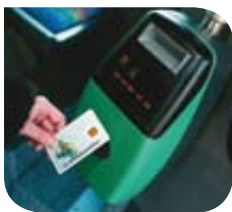
Charentes – Carte sans contact @ Transport Public