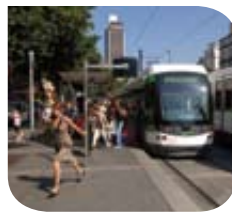
Nantes – Tramway