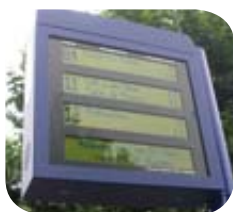
Rouen – Information voyageurs @ Ineo Systrans