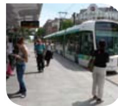
Paris – Tramway @ Objectif transport public