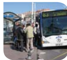
Marseille – Bus @ Transport Public